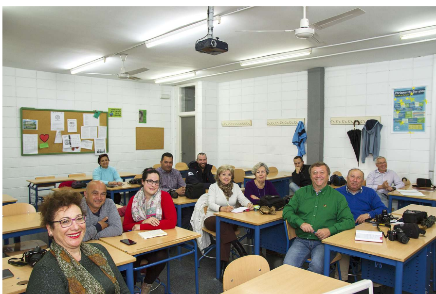
Nuestro Taller de Fotografía

En este curso se han realizado dos talleres en los que nuevamente hemos contado con la colaboración Municipal y del I.E.S. Fidiana, a quienes desde aquí queremos agradecerles.