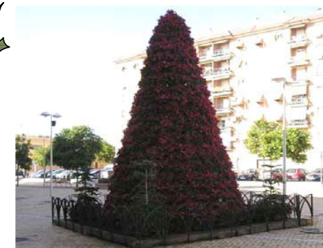
¿Lo recuerdas? Era lo único que llegaba en Navidad

Es verdad que la crisis a todos nos golpea y también lo es que nuestro barrio fue de los primeros, sino el 1º, que dio ejemplo renunciando a una iluminación escasa y de aspecto pobretón. Ahora, os pedimos que nos digáis que os parece no tener si acaso, un detalle que nos recuerde que estamos en Navidad. De vuestros comentarios tomaremos buena nota.